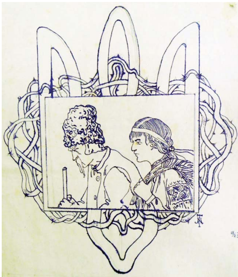
Рис. 3. Малюнок-заставка на зворотній стороні обкладинки одного з номерів часопису «Кобза», початок 1921 р., Ченстохова (Оригінал зберігається в: ЦДАВО України, ф.4465, оп.1, спр.205)