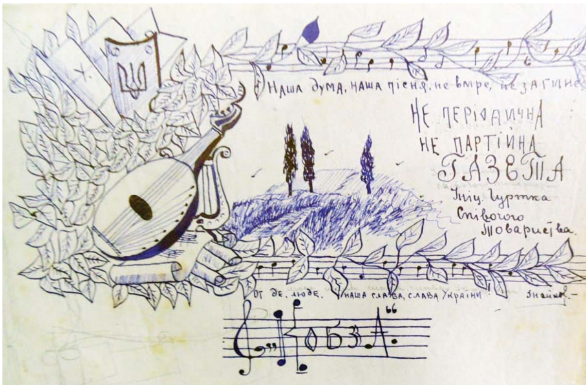
Рис. 1. Малюнок-заставка на обкладинці одного з номерів часопису «Кобза», початок 1921 р., Ченстохова (Оригінал зберігається в: ЦДАВО України, ф.4465, оп.1, спр.205)